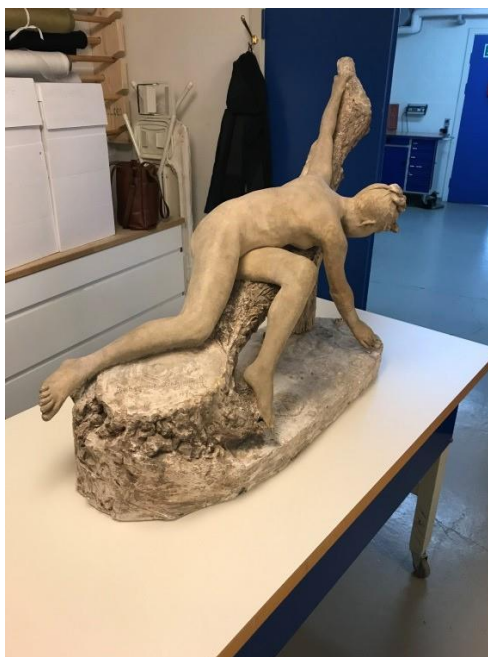
Åkandepulkeren fra Forstadsmuseet med sin skade før og efter.