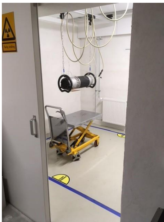
Opbygning af røntgenrum med 28 cm betonvægge og 4mm bly i skydedøren.

Kompressoren fik et fatalt nedbrud og måtte skiftes til en nyere model. Den gamle kompressor havde tjent os vel siden 1994.