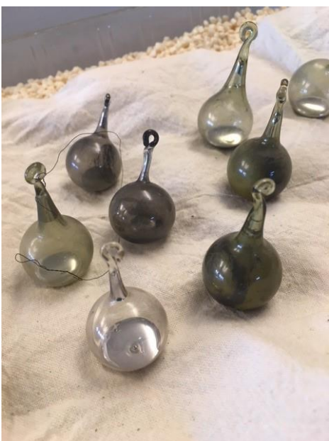
HC Ørsteds små glaskolber med kviksølv.

Danmarks Tekniske Museum fik konserveret glaskolber fra HC Ørsted.