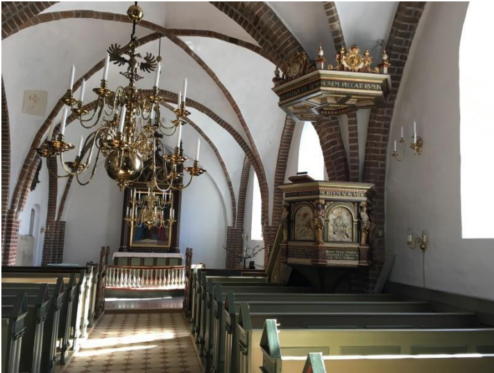
Konservingsarbejde i Herfølge Kirke.

Indenfor det arkæologiske område, har der været en del rekvirerede opgaver. Der er en tendens til at udvælgelsen af genstande til konservering fra udgravninger generelt er mere selektiv, og det gør, at der har været en nedgang i arkæologisk konservering. Om der desuden bliver fundet færre genstande, og videnskabelige analyser vægtes højere end konservering, fremgår ikke klart, men der er en tendens i den retning.