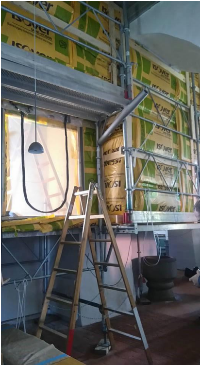
Det svampeskadede område i Ganløse Kirke isoleres og opvarmes til 70°C.

Vi vil stadig opfordre til, at Bevaring Sjælland straks bliver kontaktet, hvis der sker en pludselig skade og, at det er Bevaring Sjælland, der foretager det skadesbegrænsende arbejde med museumsgenstande og bevaringsværdige bygninger. Vi har erfaret, at vores specialviden om museumsgenstande, materialer og bevaring, kan begrænse skaden og dermed udgiften meget, hvilket er i alles interesse. Bevaring Sjællands personale kan bestemme materialer og bevaringstilstand - og derfor vurdere hvilke behandlingsmetoder museumsgenstande tåler og ikke tåler. Vi kan sikre, at der tages hånd om skaden, så der ikke opstår følgeskader med store omkostninger til følge.